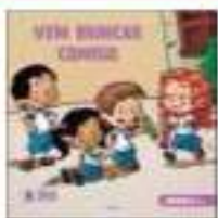
PARADIDÁTICO - SAS – ANUAL

ATENÇÃO: MATERIAL ADQUIRIDO EXCLUSIVAMENTE NA ESCOLA: PORTUGUÊS: SISTEMA ARI DE SÁ / INGLÊS