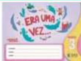
ERA UMA VEZ ... - SAS – ANUAL