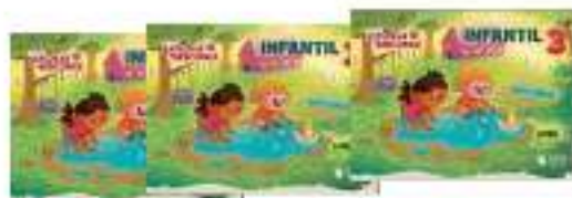
LIVRO INTEGRADO – SAS (3 LIVROS)