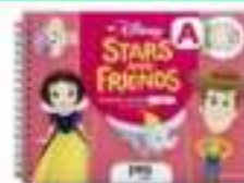
LIVROS DE INGLÊS – MY DISNEY STARS AND FRIENDS (CLASS BOOK E ACTIVITY BOOK)