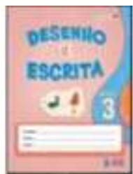
DESENHO E ESCRITA – SAS - ANUAL