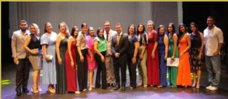
Equipe completa que organizou o espetáculo da noite dos autores