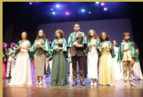
Posse dos novos membros da AJULE