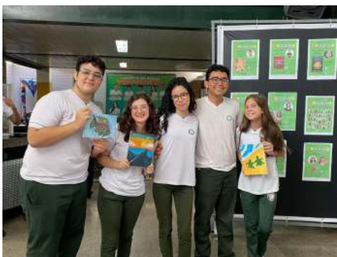
Imagem : Concurso de telas