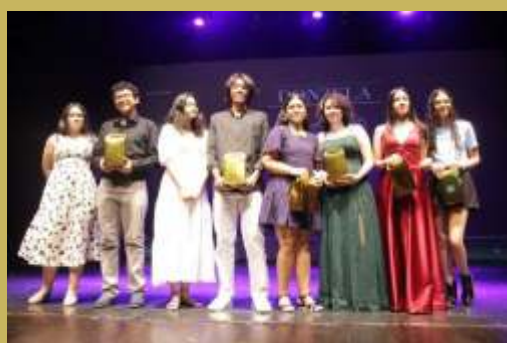
Nossos ilustradores da Academia Juvenil de Letras - AJULE