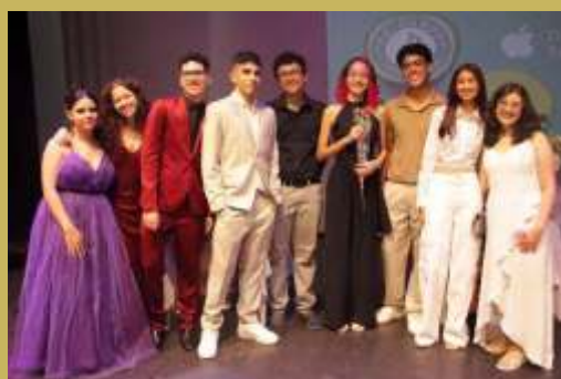
Nossos escritores da Academia Juvenil de Letras - AJULE