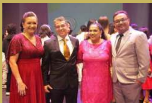
Direção e coordenação do Colégio Pro Campus Júnior