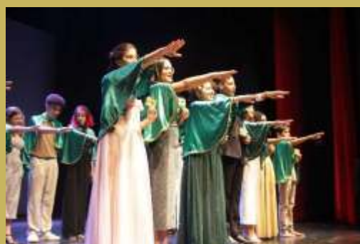
Juramento dos novos acadêmicos