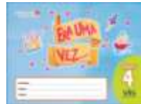
ERA UMA VEZ - SAS – ANUAL