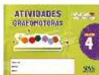
ATIVIDADES GRAFOMOTORAS SAS - ANUAL

ATENÇÃO → MATERIAL ADQUIRIDO EXCLUSIVAMENTE NA ESCOLA: PORTUGUÊS: SISTEMA ARI DE SÁ / INGLÊS: OXFORD