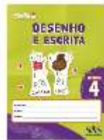
DESENHO E ESCRITA - SAS - ANUAL