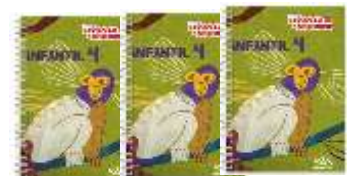
LIVRO INTEGRADO – SAS – (3 LIVROS)