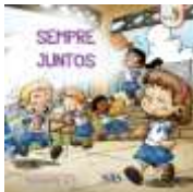
PARADIDÁTICO - SAS - ANUAL