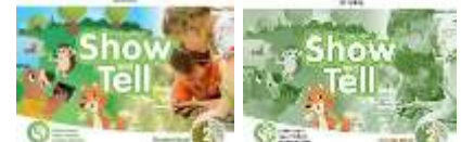
LIVROS DE INGLÊS – OXFORD – ANUAIS - Show and Tell 2 (Class Book e Activity Book)