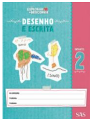
DESENHO E ESCRITA – LIVRO ANUAL

ATENÇÃO → MATERIAL ADQUIRIDO EXCLUSIVAMENTE NA ESCOLA: PORTUGUÊS: SISTEMA ARI DE SÁ / INGLÊS: OXFORD