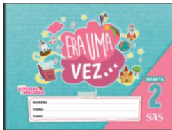
ERA UMA VEZ ... – LIVRO ANUAL