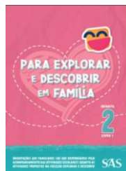
LIVRO DA FAMÍLIA - SAS