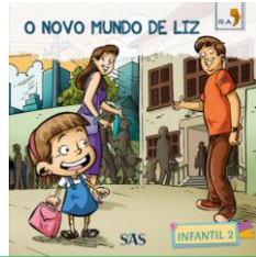
PARADIDÁTICO – ANUAL