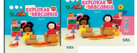
LIVROS INTEGRADOS – (2 LIVROS)