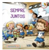
PARADIDÁTICO - SAS – ANUAL