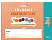
ATIVIDADES GRAFOMOTORAS - SAS - ANUAL

ATENÇÃO → MATERIAL ADQUIRIDO EXCLUSIVAMENTE NA ESCOLA: PORTUGUÊS: SISTEMA ARI DE SÁ / INGLÊS: OXFORD