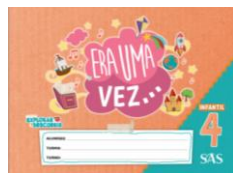
ERA UMA VEZ - SAS – ANUAL