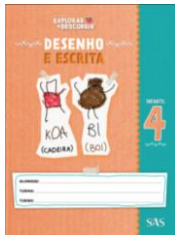
DESENHO E ESCRITA - SAS - ANUAL