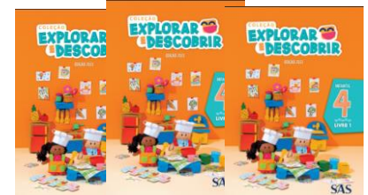
LIVRO INTEGRADO – SAS – (3 LIVROS)