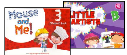
LIVROS DE INGLÊS – OXFORD – ANUAIS