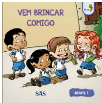
PARADIDÁTICO - SAS – ANUAL

ATENÇÃO → MATERIAL ADQUIRIDO EXCLUSIVAMENTE NA ESCOLA: PORTUGUÊS: SISTEMA ARI DE SÁ / INGLÊS: OXFORD