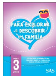
LIVRO DA FAMÍLIA – SAS - ANUAL