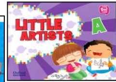
LIVROS DE INGLÊS – OXFORD - ANUAIS