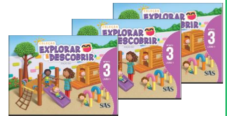
LIVRO INTEGRADO – SAS (3 LIVROS)