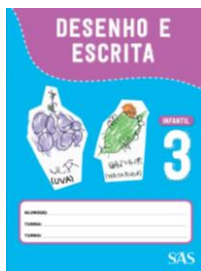
DESENHO E ESCRITA – SAS - ANUAL