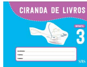
CIRANDA DE LIVROS - SAS – ANUAL