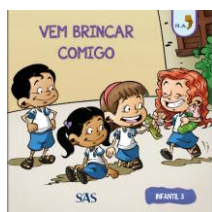
PARADIDÁTICO - SAS – ANUAL

ATENÇÃO → MATERIAL ADQUIRIDO EXCLUSIVAMENTE NA ESCOLA: PORTUGUÊS: SISTEMA ARI DE SÁ / INGLÊS: OXFORD