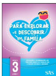
LIVRO DA FAMÍLIA – SAS (ANUAL)