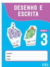
DESENHO E ESCRITA – SAS - ANUAL