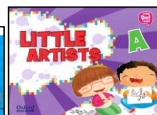
LIVROS DE INGLÊS – OXFORD - ANUAIS