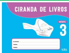
CIRANDA DE LIVROS - SAS – ANUAL