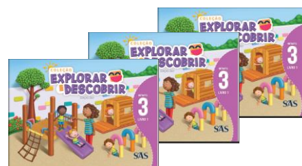
LIVRO INTEGRADO – SAS (3 LIVROS)