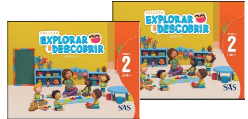
LIVROS INTEGRADOS – (2 LIVROS)