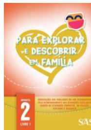
LIVRO DA FAMÍLIA - SAS