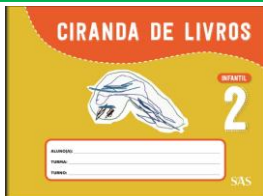
CIRANDA DE LIVROS – ANUAL