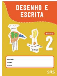
DESENHO E ESCRITA – ANUAL

ATENÇÃO → MATERIAL ADQUIRIDO EXCLUSIVAMENTE NA ESCOLA: PORTUGUÊS: SISTEMA ARI DE SÁ / INGLÊS: OXFORD