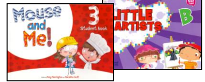
LIVROS DE INGLÊS – OXFORD – ANUAIS