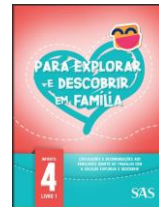
LIVRO DA FAMÍLIA - SAS