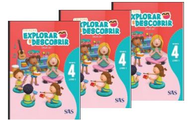
LIVRO INTEGRADO – SAS – (3 LIVROS)