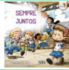
PARADIDÁTICO - SAS – ANUAL