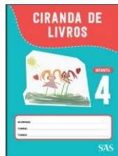
CIRANDA DE LIVROS - SAS – ANUAL