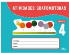
ATIVIDADES GRAFOMOTORAS - SAS - ANUAL

ATENÇÃO → MATERIAL ADQUIRIDO EXCLUSIVAMENTE NA ESCOLA: PORTUGUÊS: SISTEMA ARI DE SÁ / INGLÊS: OXFORD