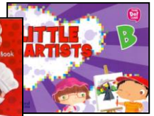
LIVROS DE INGLÊS – OXFORD – ANUAIS