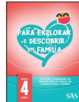
LIVRO DA FAMÍLIA - SAS