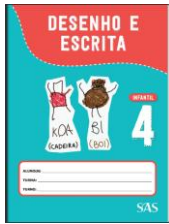
DESENHO E ESCRITA - SAS - ANUAL