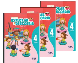
LIVRO INTEGRADO – SAS – (3 LIVROS)