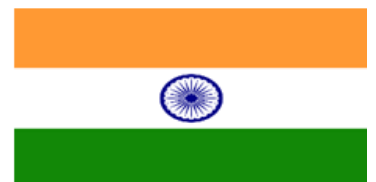
Bandeira da atual Índia

🚩 Sobre essa sociedade, responda ao que se pede. (1,0)