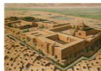
Representação das primeiras cidades mesopotâmicas.

a) Quais os dois principais rios que foram importantes para o surgimento das civilizações mesopotâmicas?