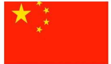
Bandeira da atual China

a) Quais os dois principais rios que foram importantes para o surgimento da civilização chinesa?