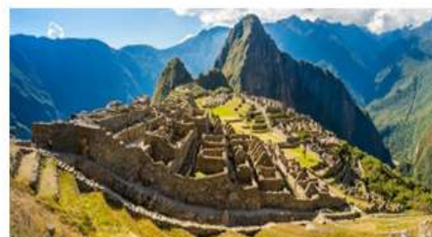
Antigas construções Incas localizado em Machu Picchu, capital do Peru.

a) Qual o principal rio que foi importante para o surgimento da civilização Inca?