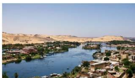
Figura 1- Rio Nilo.

1. Observe com atenção as imagens e, em seguida, faça o que é solicitado. (1,0)