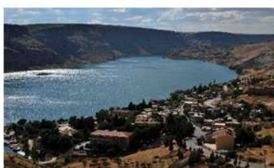
Figura 2- Rio Eufrates.