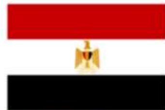
Bandeira do atual Egito.

a) Qual o principal rio que foi importante para o surgimento da civilização egípcia?