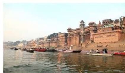
Figura 3 - Rio Ganges.

a) Os rios representados acima foram importantes para grandes civilizações! Identifique quais foram as civilizações abastecidas por cada um deles.