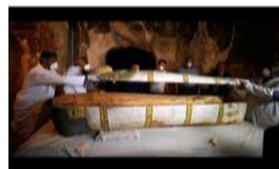
Sarcófago de 3 mil anos sendo aberto por arqueólogos no Egito.

b) Por qual motivo os egípcios mumificavam seus mortos?