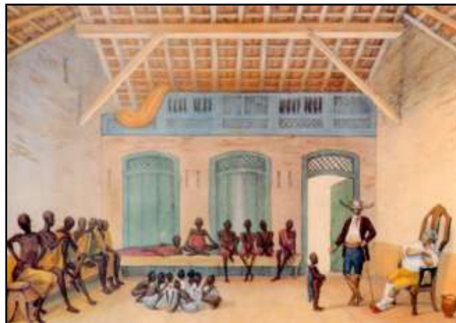
Jean Baptiste Debret, mercado da Rua Valongo, viagem pitoresca e histórica ao Brasil, 1834.

( ) Engenho é o nome dado ao local onde os escravos moravam com suas famílias.