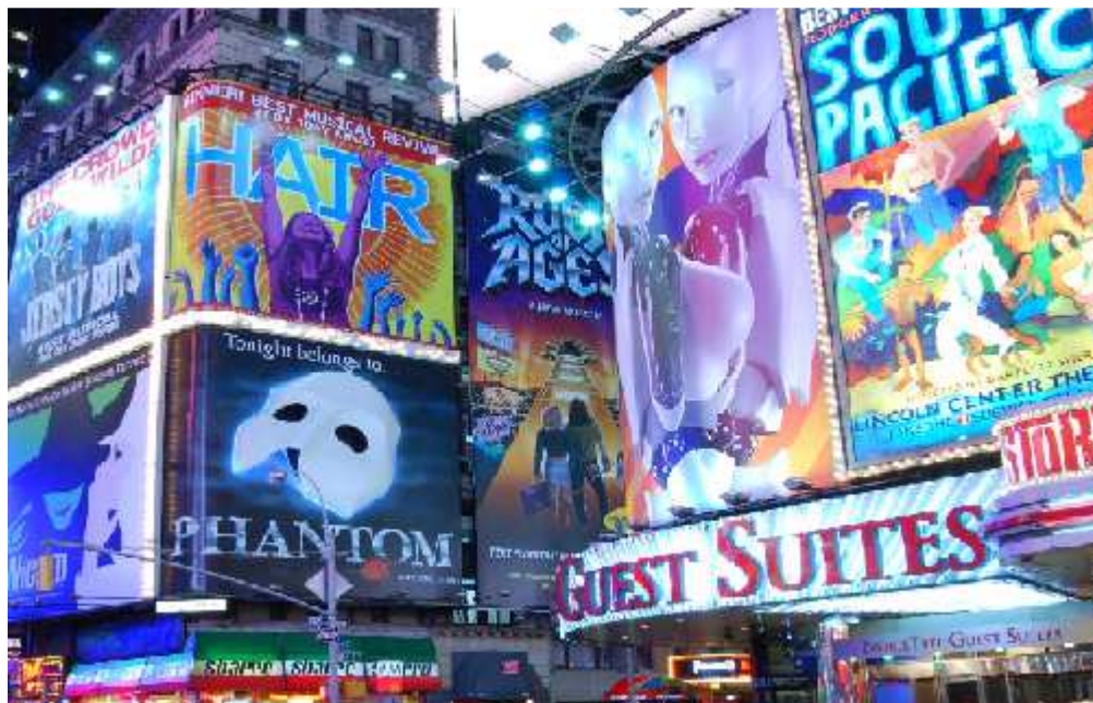
Figura 8: Times Square.