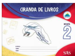
CIRANDA DE LIVROS – ANUAL