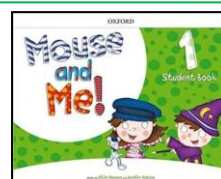
LIVRO DE INGLÊS OXFORD – ANUAL