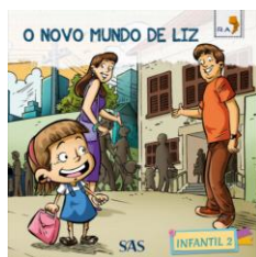
PARADIDÁTICO – ANUAL