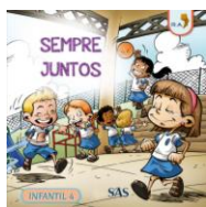
PARADIDÁTICO - SAS – ANUAL

ATENÇÃO → MATERIAL ADQUIRIDO EXCLUSIVAMENTE NA ESCOLA: SISTEMA ARI DE SÁ / INGLÊS: UNOi – Bilingual Education