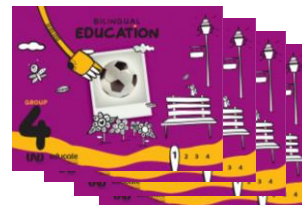
INGLÊS: UNOi Bilingual Education (4 livros)