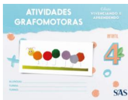
ATIVIDADES GRAFOMOTORAS - SAS - ANUAL