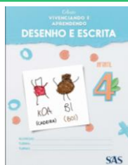
DESENHO E ESCRITA - SAS - ANUAL