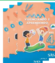
LIVRO INTEGRADO – SAS – (3 LIVROS)