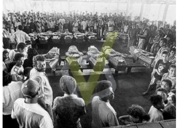
Velório das 19 vítimas

Em abril de 1996, 19 camponeses sem-terra foram mortos pela polícia militar no episódio que ficou mundialmente conhecido como Massacre de Eldorado de Carajás, ocorrido no sudeste do Pará. Os participantes do Movimento dos Sem Terra faziam uma caminhada até a cidade de Belém, quando foram impedidos pela polícia de prosseguir. Mais de 150 policiais foram destacados para interromper a caminhada, o que levou a uma ação repressiva extremamente violenta.