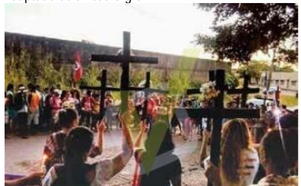
Ato em solidariedade às 10 vítimas