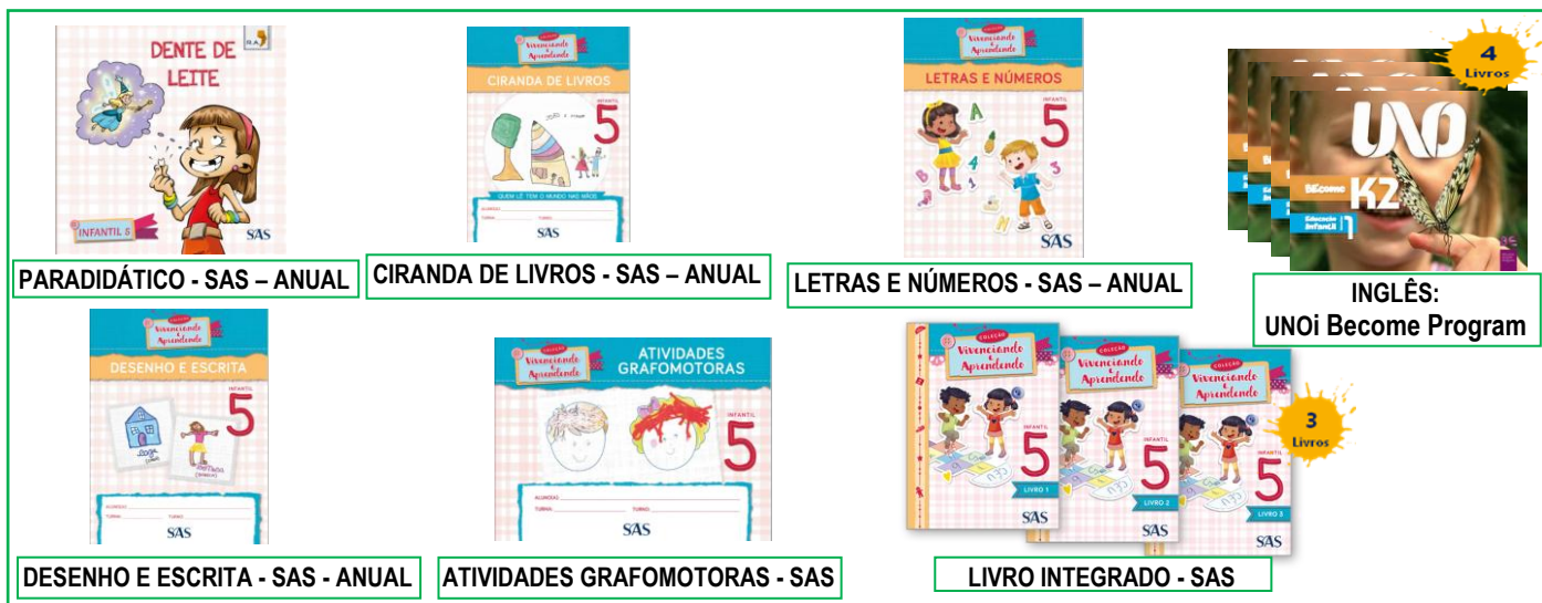
PARADIDÁTICO - SAS – ANUAL

ATENÇÃO → MATERIAL ADQUIRIDO EXCLUSIVAMENTE NA ESCOLA: SISTEMA ARI DE SÁ / INGLÊS: UNOi – Become Program