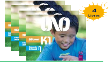
INGLÊS: UNOi Become Program