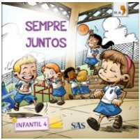
PARADIDÁTICO - SAS – ANUAL

ATENÇÃO → MATERIAL ADQUIRIDO EXCLUSIVAMENTE NA ESCOLA: SISTEMA ARI DE SÁ / INGLÊS: UNOi – Become Program