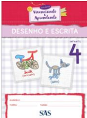
DESENHO E ESCRITA - SAS - ANUAL