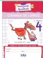
CIRANDA DE LIVROS - SAS – ANUAL