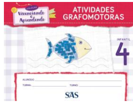
ATIVIDADES GRAFOMOTORAS - SAS