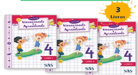
LIVRO INTEGRADO - SAS